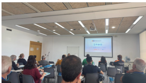
Fotografia de la sessió de cloenda amb diàleg obert del projecte europeu RESIST.

El diàleg girà al voltant dels principals temes, problemàtiques i idees que s'han identificat al llarg del procés participatiu en relació amb les temàtiques mencionades. Per facilitar aquest diàleg, l'equip de la UOC va compartir resums del que s'havia discutit prèviament en les diferents taules i trobades que han fet al llarg del procés participatiu.