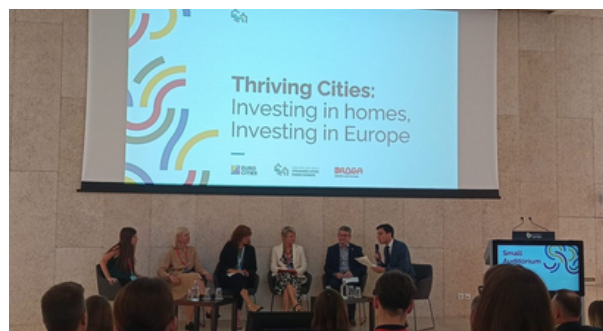
Fotografia de la sessió sobre instruments de finançament i rol de la Unió Europea davant la crisi d'habitatge a l'Assamblea General d'EUROCITIES.