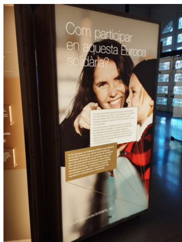
Fotografia de l'exposició "Europa, el nostre espai comú".