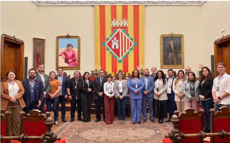
Fotografia de la trobada amb la delegació de Roraima al Saló de Sessions de l'Ajuntament.

L'Ajuntament ha presentat també exemples pràctics d'aplicació de solucions TIC orientades a la millora de l'eficiència, la participació ciutadana i la sostenibilitat urbana. La jornada ha servit per reforçar l'intercanvi de coneixement i bones pràctiques entre administracions.