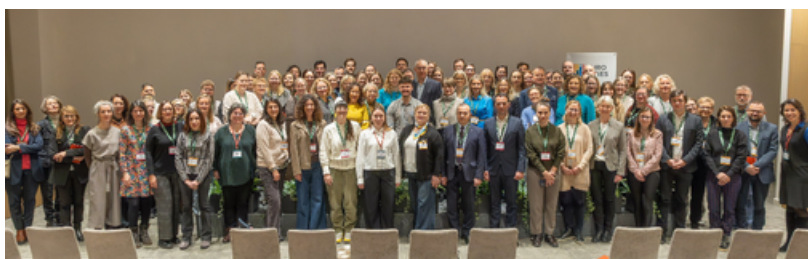
Reunió dels representants de ciutats europees a Vilnius, Lituània.

Al llarg de tres dies, el programa va combinar sessions formatives, debat polític, visites d'estudi i espais de networking, amb un focus clar en enfortir la capacitat de les ciutats per incidir en les polítiques europees i accedir de manera més efectiva al finançament de la UE.