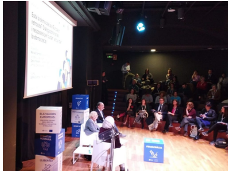
Fotografia dels ponents Manuela Carmena i Daniel Innerarity.

El servei de Relacions Internacionals va assistir a les XXVI Trobades Municipals Europees, organitzades per la Diputació de Barcelona, en col·laboració amb l'Oficina del Parlament Europeu i la Representació de la Comissió Europea a Barcelona, celebrades a la Ciutat Comtal.