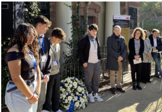
Commemoració en Memòria de les Víctimes de l'Holocaust amb les Escoles Ambaixadores del Parlament Europeu a Terrassa.