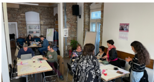
Fotografia de la trobada dels participants del projecte SMI Tour.

Durant la trobada, celebrada a l'Impact Hub Athens, es van compartir estratègies amb pimes, institucions culturals i altres agents del sector per desenvolupar un Pla d'Acció comú. S'hi van abordar temes com la digitalització del patrimoni industrial, les oportunitats de finançament i l'ús de tecnologies emergents com per exemple la realitat augmentada.