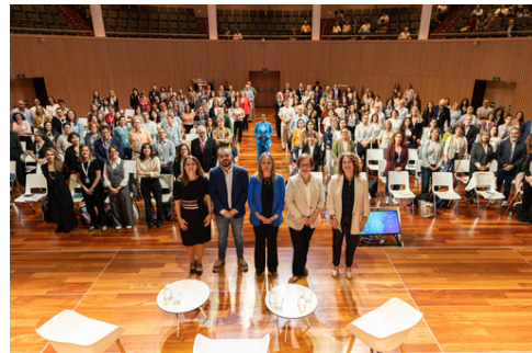
Foto grupal dels membres de la Xarxa Mundial de Governos Locals i Regionals de Polítiques del Temps.

L'Ajuntament de Terrassa és membre de la Xarxa Mundial dels Governos Locals i Regionals de Polítiques del Temps, una xarxa formada per municipis, metròpolis i altres governs locals i regionals interessats a fomentar polítiques de temps. Els seus objectius són el de compartir coneixements entre els seus membres, desenvolupar l'Agenda Local i Regional de Polítiques Horàries i promoure el dret al temps. Els membres de la xarxa es van reunir al mes d'octubre a Barcelona, en el marc de la Time Use Week 2025, on van celebrar l'assemblea general de la xarxa.